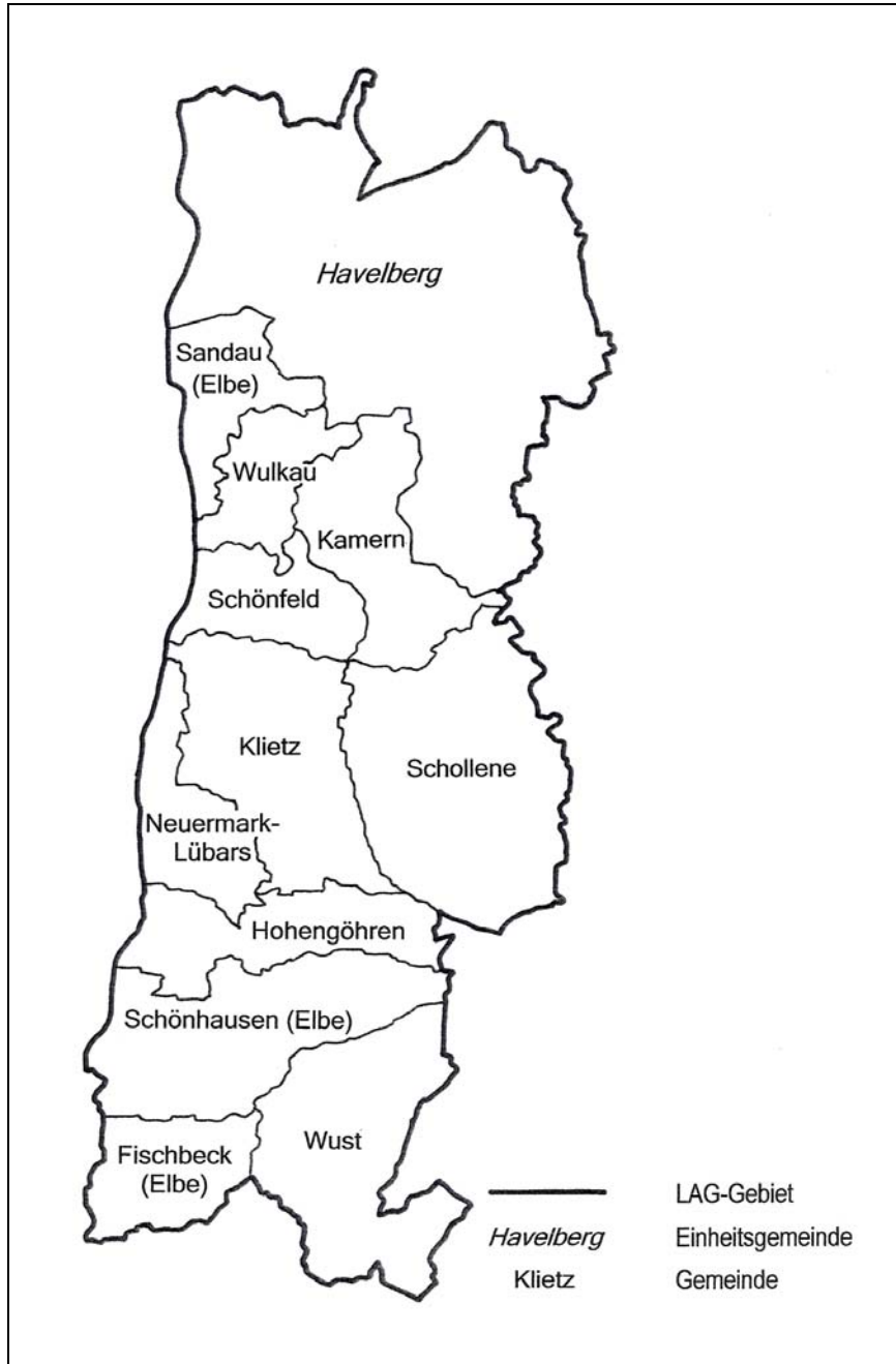
Gemeinden im LAG-Gebiet